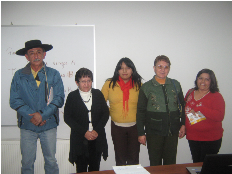
DIRECTORIO CONSEJO DE DESARROLLO DE S ALUD