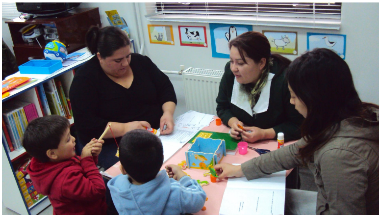
SALA DE ESTIMULACION "CHILE CRECE CONTIGO"