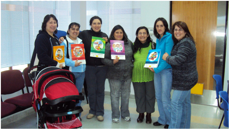
TALLER "NADIE ES PERFECTO"