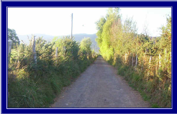
CAMINO VECINAL LAS NENAS – POSIBLE TRAZADO FUTURO COLECTOR A. SERVIDAS