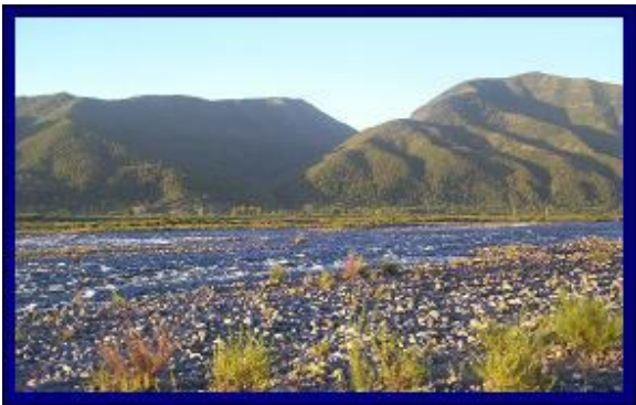
CAUCE RIO LAJA – ZONA PROPUESTA PARA POSIBLE FUTURA DISPOSICION SISTEMA ALCANTARILLADO AGUAS SERVIDAS