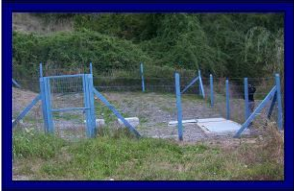
CAMARA DE VALVULAS SISTEMA AGUA POTABLE ANTUCO