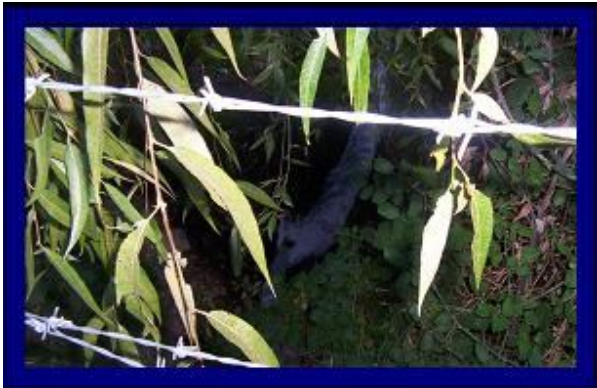
REBALSE DE CAMARA DE VALVULAS A CAUCE NATURAL