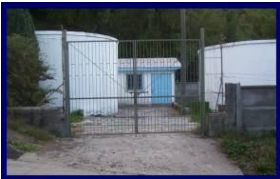
ESTANQUES DE REGULACION SISTEMA AGUA POTABLE ANTUCO