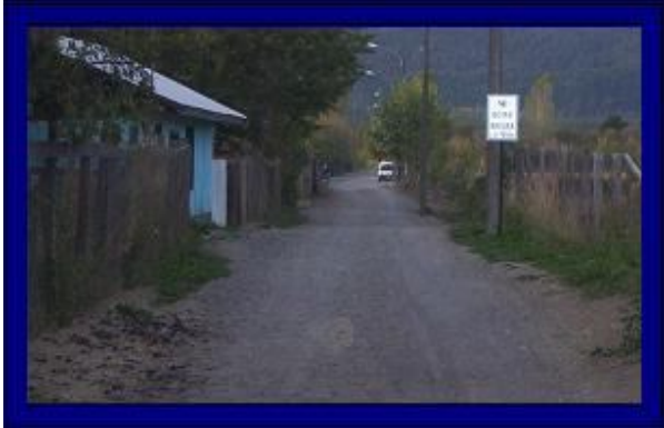
CALLE 11 DE SEPTIEMBRE - POSIBLE TRAZADO FUTURO COLECTOR AGUAS SERVIDAS